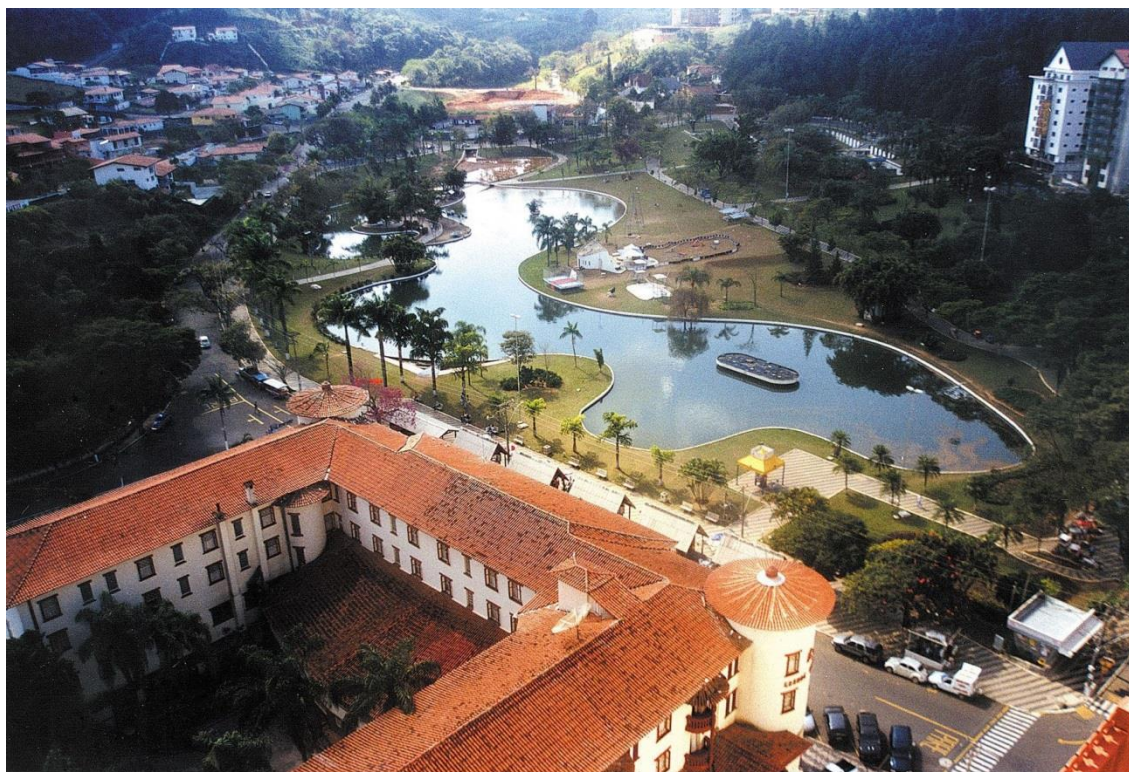
Figura 4. Praça Adhemar de Barros, Águas de Lindóia