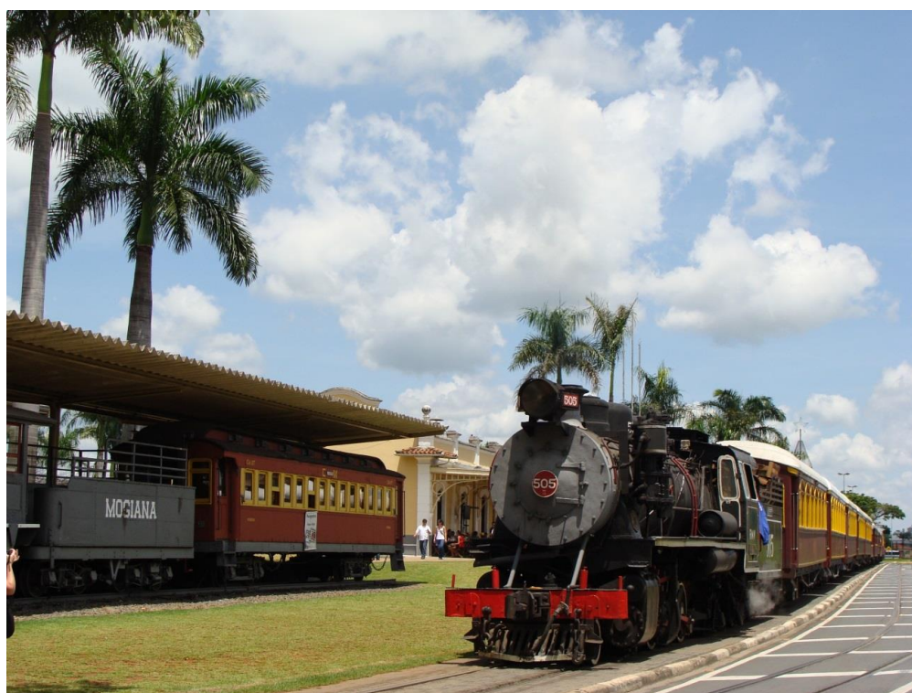
Figura 6. Maria Fumaça, Jaguariúna.