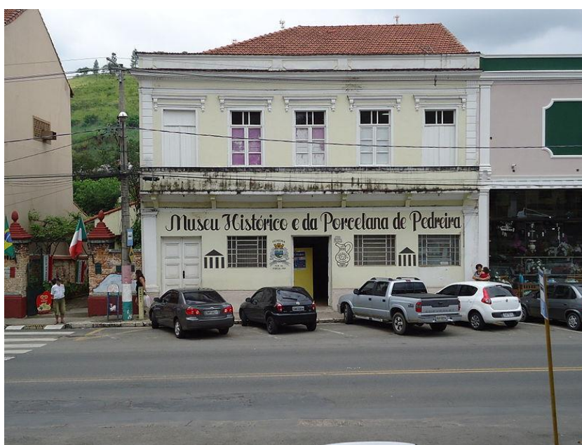
Figura 8. Museu de Porcelanas, Pedreira