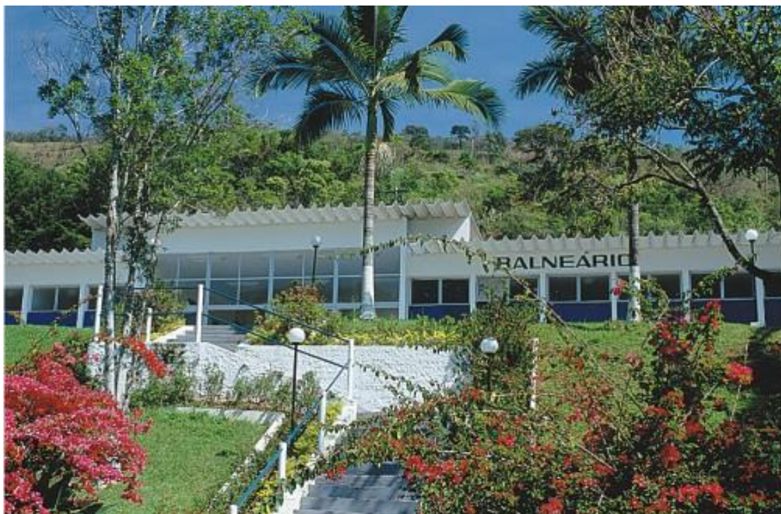
Figura 9. Balneário, Socorro