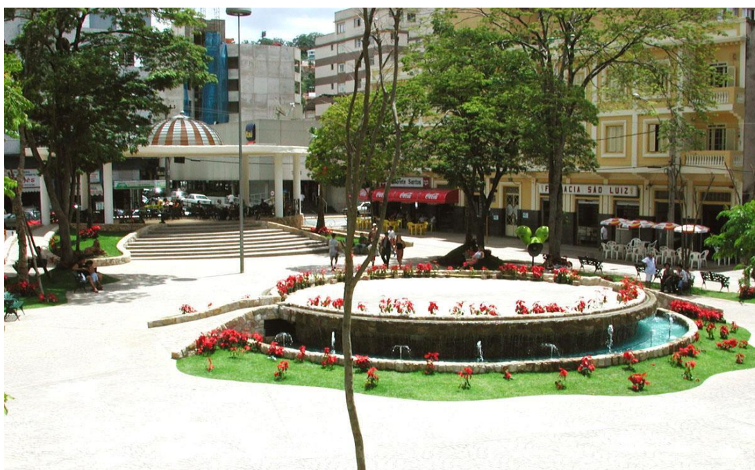
Figura 3. Praça Prefeito João Zelante, Serra Negra