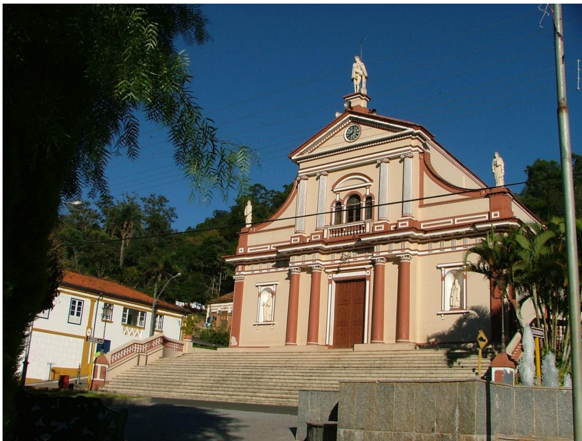
Figura 7. Santuário Senhor Bom Jesus, Monte Alegre do Sul