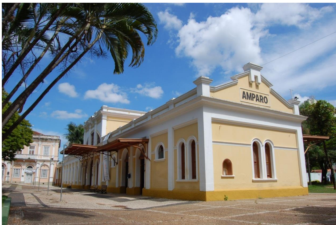
Figura 2. Praça Pádua Salles, Amparo