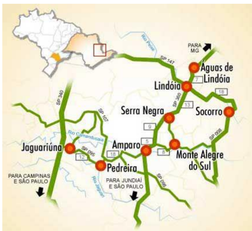
Figura 1. Municípios que integram o Circuito das Águas Paulista