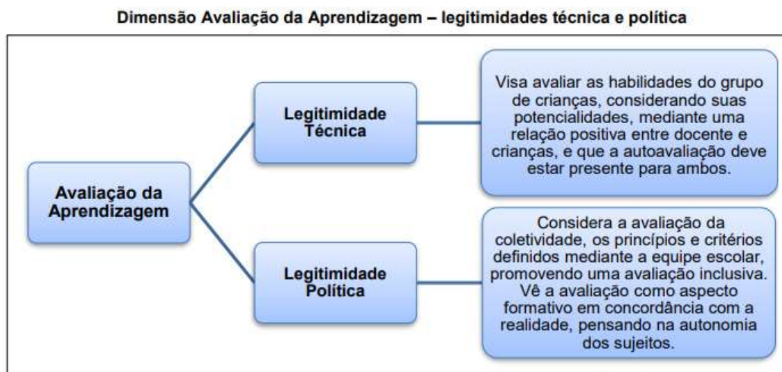
Figura 7: Dimensão da Avaliação da Aprendizagem – legitimidades técnica e política (DCRMSAvII, p. 345-346).