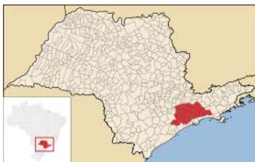
Figura 1: Região Metropolitana de São Paulo