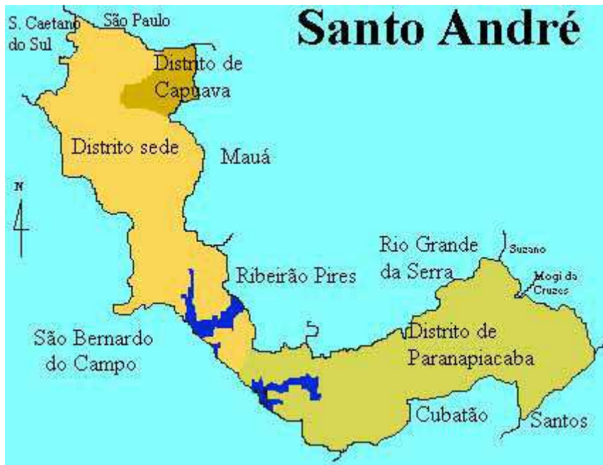
Figura 2: Localização Geográfica do município de Santo André