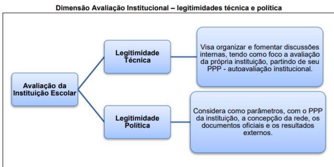
Figura 8: Dimensão da Avaliação Institucional – legitimidades técnica e política