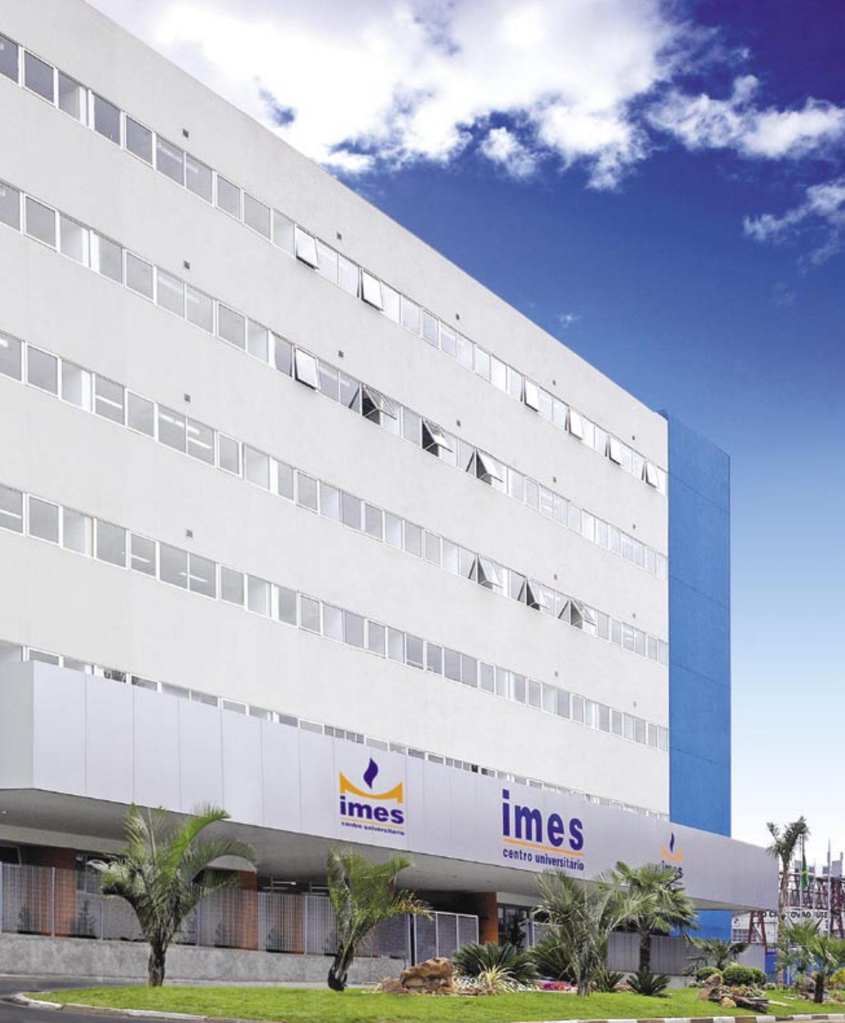
Campus II: Rua Santo Antônio, 50, Centro, São Caetano do Sul