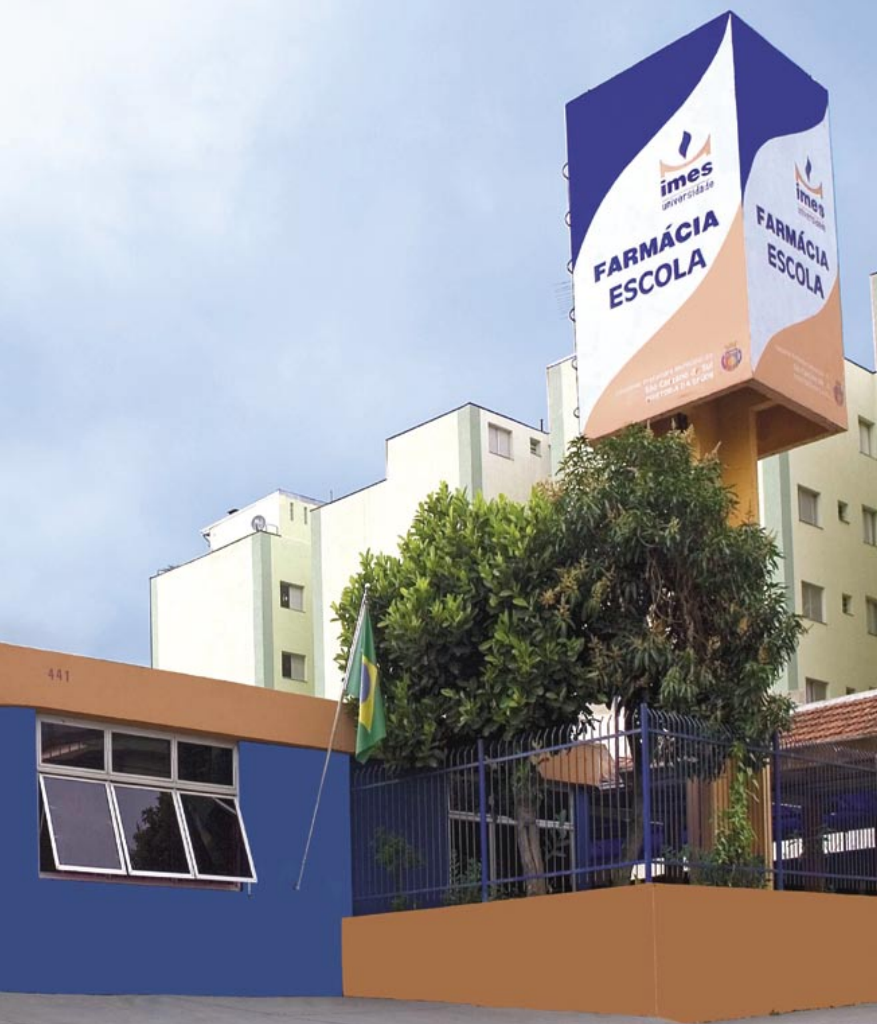
Farmácia-Escola (FarmaIMES): Rua Tibagi, 457, Bairro Santa Maria, São Caetano do Sul